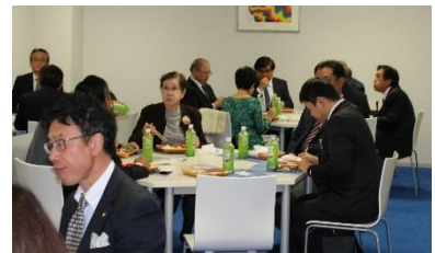
昼食は、GABAライスとコメカラのお弁当をいただきました。